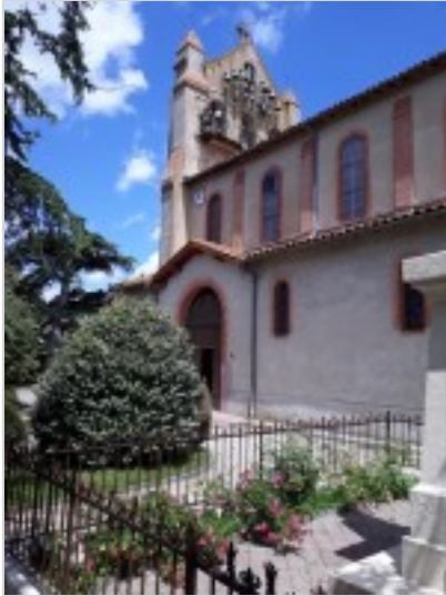
Eglise Saint Remi